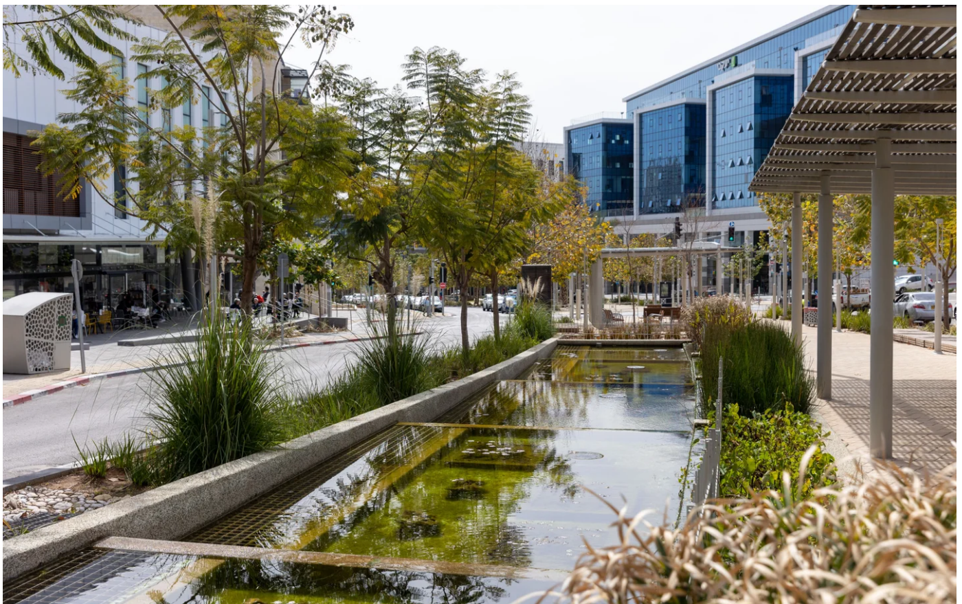
חלק מהשדרה העירונית במודיעין במתכונתה החדשה