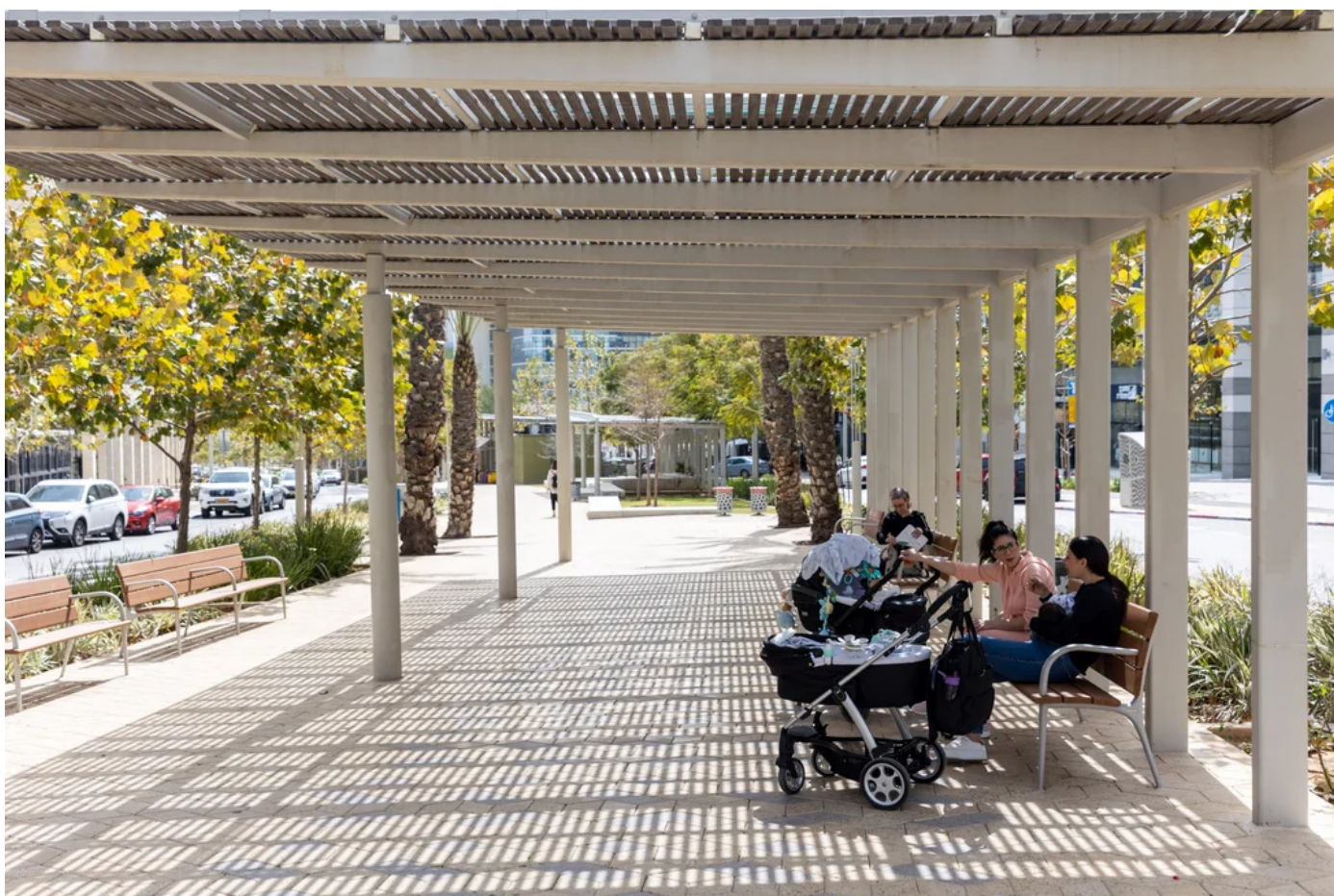
תושבים בשדרה העירונית במודיעין במתכונתה החדשה

את טיפוס הבנייה בעיר הוא הגדיר כ"קוביות לגו". גובה הבנייה הוגבל לרוב לשלוש-ארבע קומות כדי לשמור על תצורת הגאיות מול שיפולי הגבעות. שיאי הגבעות סומנו במגדלים. כשמסתובבים בשכונות הוותיקות, מתגלה אווירה קיבוצית-כפרית עם רצועות ירוקות המובילות לפארקים. בשכונות החדשות, האווירה הכפרית מיטשטשת שכן הבניינים גבוהים יותר, הכבישים סואנים יותר וצמחייה לא יכולה לטשטש את הכיעור המסוים.