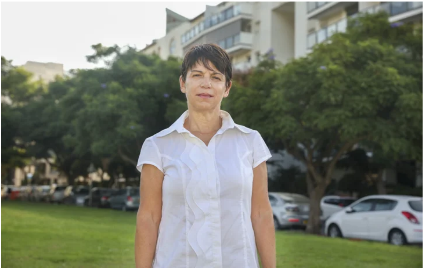
מליס: העיר צריכה לעמוד בפני עצמה